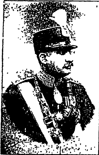
حضرة صاحب الجلالة وصاحبه مهلوى امبراطور ايران